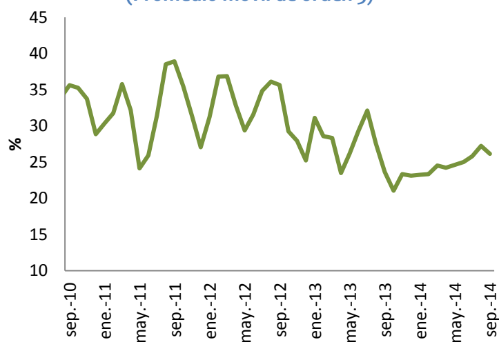
Gráfico 3. Disposición a comprar vivienda (Promedio móvil de orden 3)