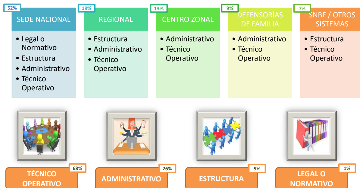
Figura 3. Recomendaciones del estudio