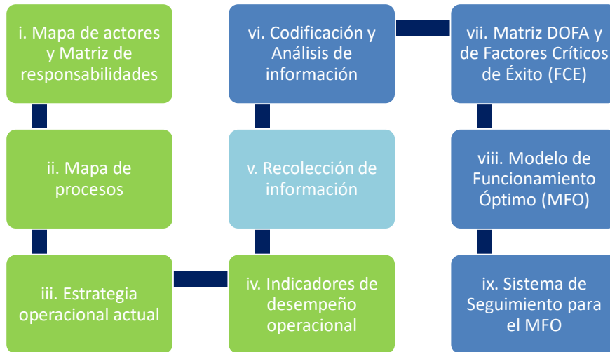
Figura 1. Fases de la evaluación

Datos secundarios: Sistema de Información Misional del ICBF