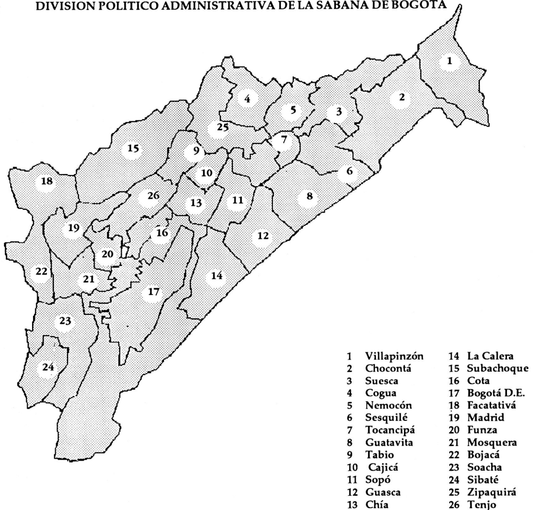
Mapa 1 DIVISION POLITICO ADMINISTRATIVA DE LA SABANA DE BOGOTA

principales direcciones del desarrollo regional en todos los ámbitos.